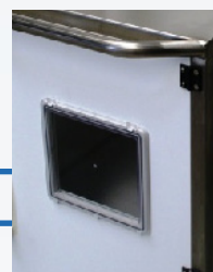
Sortie TAVL 24