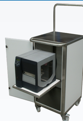
CHARIOT avec tablette extraite